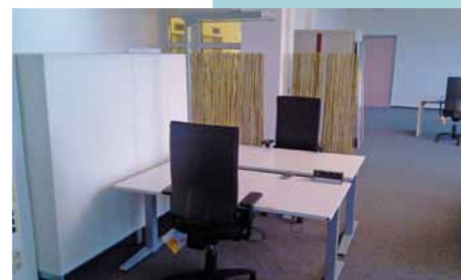
Mobiliar aus dem SiemensOffice-Katalog: links die kleinen Standardarbeitsplätze mit Sichtschutz aus Naturimitat und rechts das Lounge-Mobiliar in der Teeküche.

36 Prozent der Frauen und 44 Prozent der Männer sagen, dass sie im Job häufig unter Zeitnot und Leistungszwang leiden. Das ist das Ergebnis einer Befragung von knapp 13.700 Beschäftigten im Auftrag des Robert-Koch-Instituts.