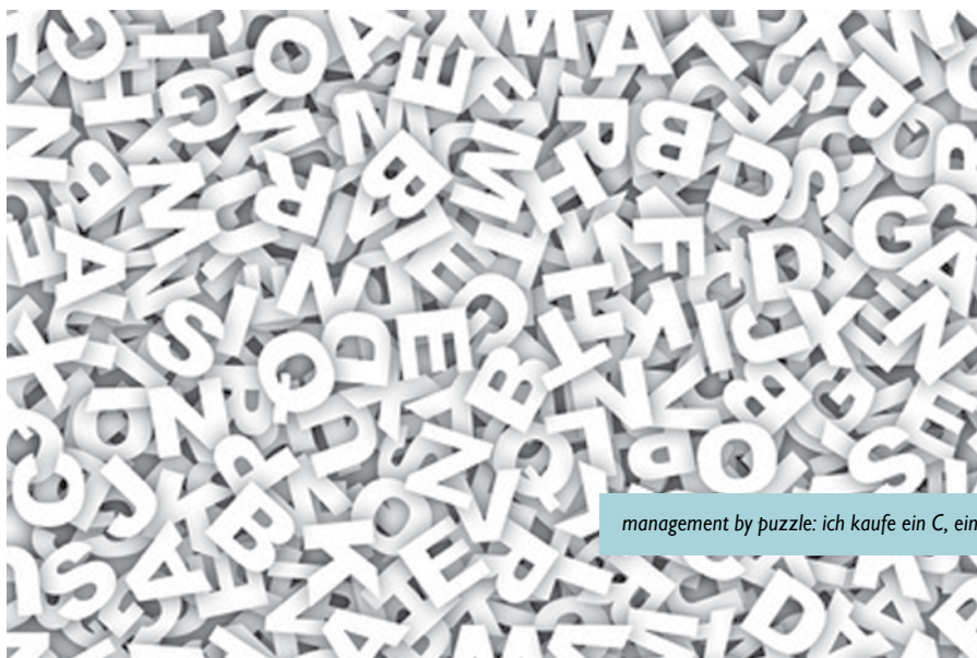
management by puzzle: ich kaufe ein C, ein L, ...