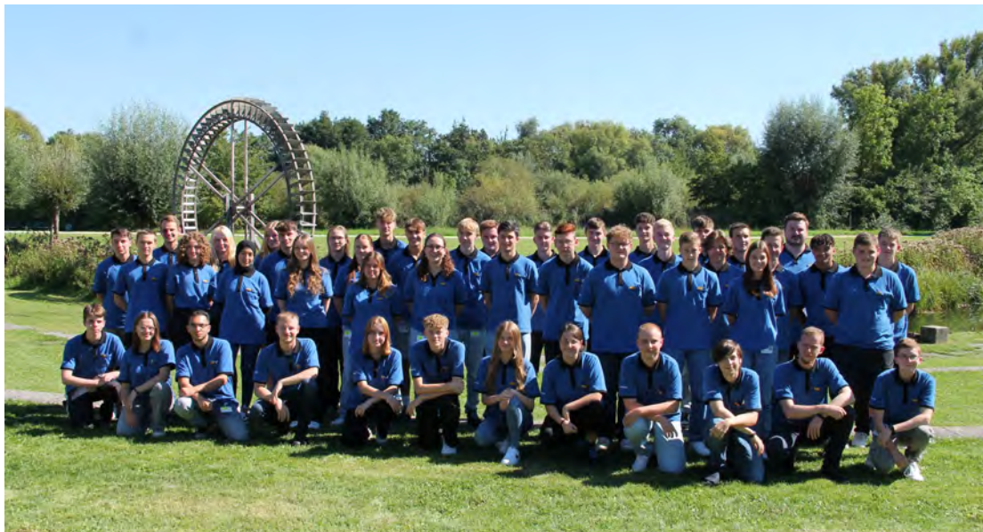
Teilnehmende der Schnitzeljagd im Rahmen der Auftaktwoche

Unsere Jugend- und Auszubildendenvertretung (JAV) organisierte eine erfolgreiche Schnitzeljagd als Teil der Auftaktwoche