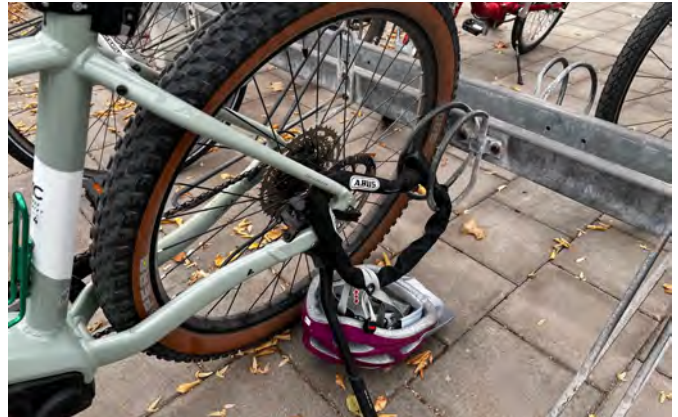
Fahrradhalterungen werden angepasst

Es gibt ein paar wichtige Neuigkeiten rund ums Fahrrad. Leider kommt es immer wieder mal vor, dass ein Fahrrad aus dem Fahrradständer entwendet wird. Bislang konnten Diebe unerkannt Fahrräder entwenden.