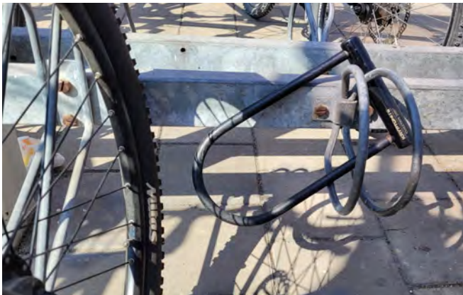
Ständig angebrachte Fahrradschlösser werden entsorgt