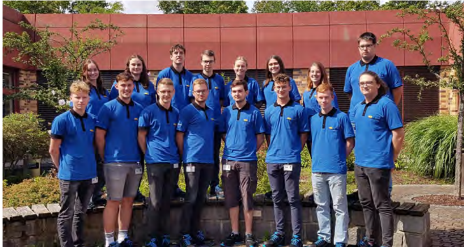
Dual Studierende zu Beginn Ihrer Ausbildung

Zum 01.08.2023 sind 16 dual Studierende sowie zum 01.09.2023 46 Auszubildende bei Siemens in Amberg in ihr Berufsleben gestartet. In ihre berufliche Zukunft starten sie in folgenden Berufen: Mechatroniker*in, Elektroniker*in für Geräte und Systeme, Verfahrensmechaniker*in, Fachlagerist*in, Werkstoffprüfer*in, Industriekaufrau (w/m/d) und Koch (m/w/d)