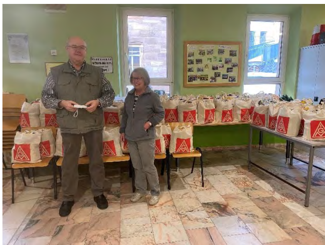
Tafelaktion 2022: Übergabe der Taschen an die Fürther Tafel e.V.

Daher ist es uns Betriebsräten am Standort auch in diesem Jahr eine -Angelegenheit, die Aktion „ Wir geben was ab “ der IG Metall und der IG Metall Vertrauensleute am Standort Fürth zu unterstützen.